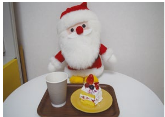
栄養士手作りのクリスマスケーキ

※レスパイト：在宅でケアしている家族を癒すため、一時的にケアを代替えし、リフレッシュを図ってもらう家族支援