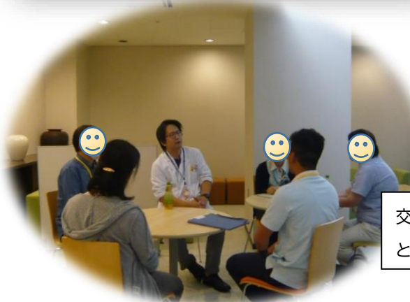
交流会の様子。スタッフに直接話ができてよかった という意見をいただきました。